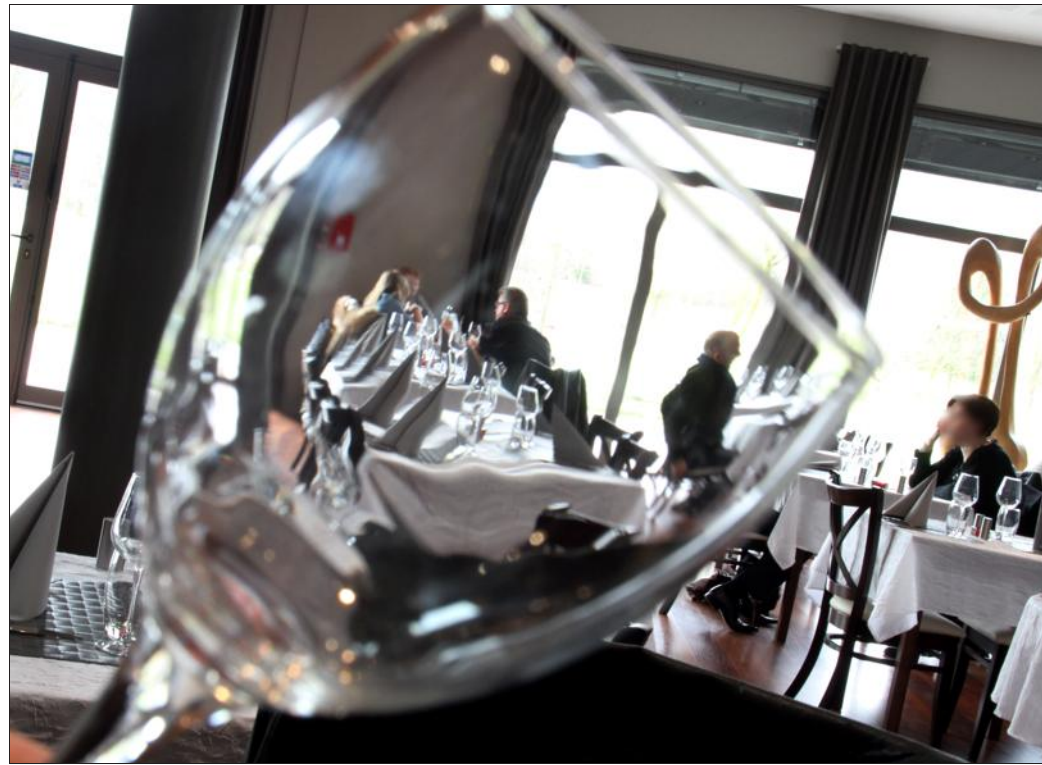
La convention liant la CCAM et le dernier gestionnaire est arrivée à terme. Et le dernier appel d'offres s'est montré infructueux. Du coup, c'est le stand-by.