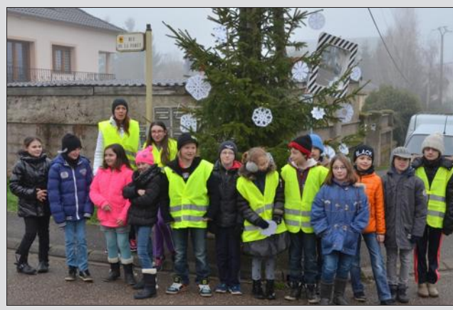
Les enfants de l'école élémentaire ont décoré les sapins du village.

Les enfants de l'école élémentaire d'Ébersviller ont réalisé avec leurs institutrices de belles décorations ludiques et originales pour embellir la dizaine de sapins de Noël installés à l'initiative de l'association des arboriculteurs d'Ébersviller Férange. Les associations des arboriculteurs et Famille rurale ont d'ailleurs organisé un concours pour les habitants de la commune, ayant pour thème "La décoration de Noël devant vos habitations". Trois catégories sont distinguées : La plus belle crèche, le plus beau sapin et les plus belles illuminations. S'inscrire avant le 21 décembre auprès de MM. Michel Nousse ou Patrice Mery. Tous les participants seront conviés à la remise des prix en janvier.