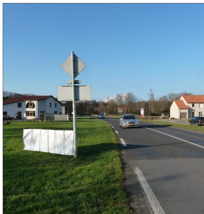
À partir de cet endroit partira le chemin piétonnier.

Excellente nouvelle attendue depuis des lustres, le maire a présenté le projet de requalification des espaces publics proposé par la CCAM lors du dernier conseil municipal. Il s'agit d'un chemin piétonnier qui commencera zone artisanale pour se terminer au pont de la Canner, face à la sapinière. Par ailleurs, considérant la volonté unanime des maires exprimée en décembre 2014 de mettre un terme au système de transfert des charges au réel pour le calcul et l'évolution des attributions de compensation, et la volonté de la CCAM de procéder à un toilettage de ses statuts pour se recentrer sur des compétences de projet pleinement exercées, les élus, réunis autour de Claude Hebbing, maire, ont décidé d'approuver le projet de nouveaux statuts de la CCAM tel qu'adopté par son conseil communautaire le 17 novembre dernier. Le préfet sera sollicité pour que la prise en compte de la nouvelle répartition des compétences entre les communes membres de la CCAM et l'EPCL intervienne, si possible, à compter du 1 er janvier 2016. Concernant le concours du receveur municipal (attribution d'indemnité), les élus demandent le concours du receveur municipal pour assurer des prestations de conseil, d'accorder l'indemnité de