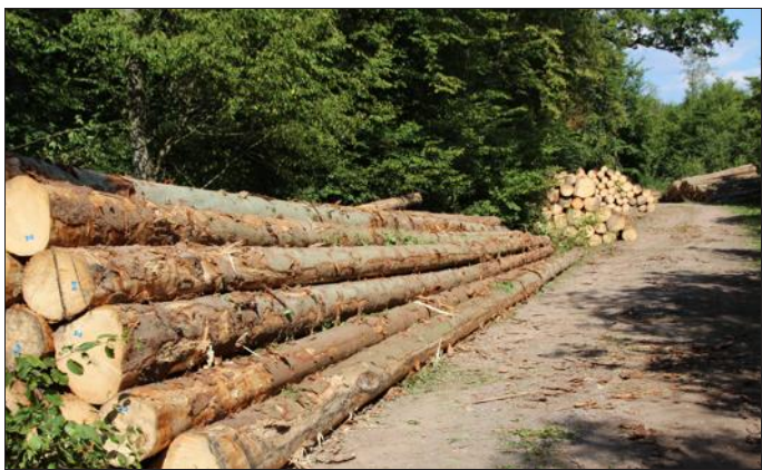
Plantés en 1953, les épicéas du Reitholz étaient sous la menace du scolyte.