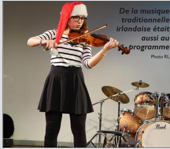
De la musique traditionnelle irlandaise était aussi au programme.