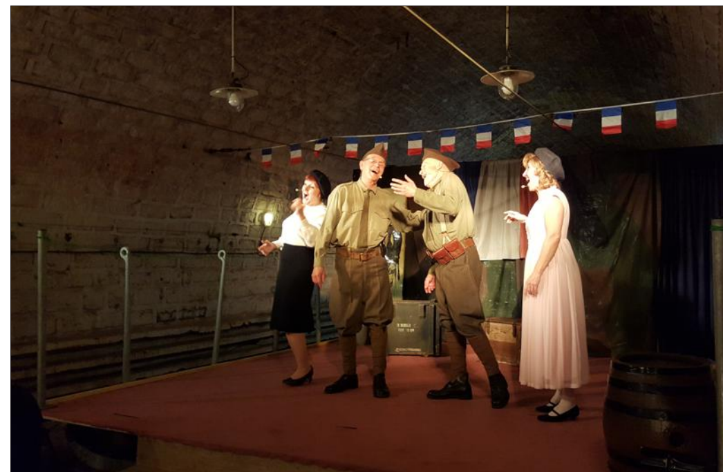
Une troupe toujours au top pour un public nombreux et ravi.

Pichard, lui, n'a pas le moral. Ça doit être la bêtise. Faut dire qu'il est confiné depuis des semaines à quel que cent mètres sous terre dans le Fort du Hackenberg. Suite à une de ses bourdes habituelles, le capitaine lui a sucé ses permis. Heureusement que Lacosse est là pour lui remonter le moral. Sans compter les copains des armées alliées : le soldat O'Belloc, du cantonnement anglais, qui s'occupe avec Pichard du ravitaillement (en