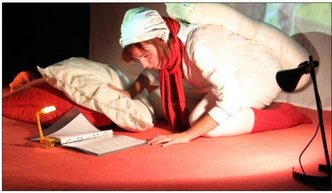
Un nombreux public a assisté à la représentation.

La bibliothèque municipale de Distroff a accueilli la lecture spectacle « Le Marchand de Sable » par la troupe de théâtre Nihil Nihil. Une belle récompense pour la participation aux actions « Insolivres » et « Lire en Fête... partout en Moselle ! » initiés par le Conseil Départemental.