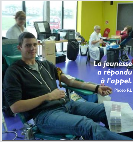
La jeunesse a répondu à l'appel.