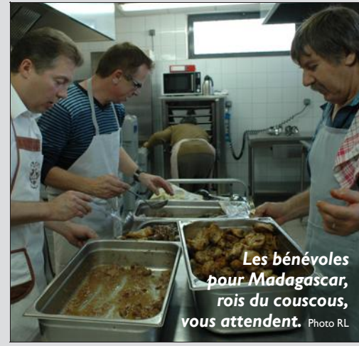
Les bénévoles pour Madagascar, rois du couscous, vous attendent.

L'association de Soutien au Foyer de L'Espérance Îles aux Nattes (Madagascar) organise un repas au profit de l'orphelinat de l'île le dimanche 25 octobre, dès midi, salle Arc-en-ciel de Volstroff (vaste parking à côté). Au menu (22 € pour adultes) apéritif, couscous royal, dessert, café, pâtisseries. Les bénéficiaires seront intégralement reversés au Foyer de l'orphelinat. Mais il faut s'inscrire avant le 18 octobre auprès de : Bernadette Jung (Stuckange) 03 82 56 92 28 ; Chantal Heureux (Thionville) 03 82 53 85 66 ; Nelly Bouches (Reinange) 03 82 56 95 31 ; Marie-Thérèse Veynard (Volstroff) 03 82 56 90 70 ; Eliane Sorne (Volstroff) 03 82 56 91 17.