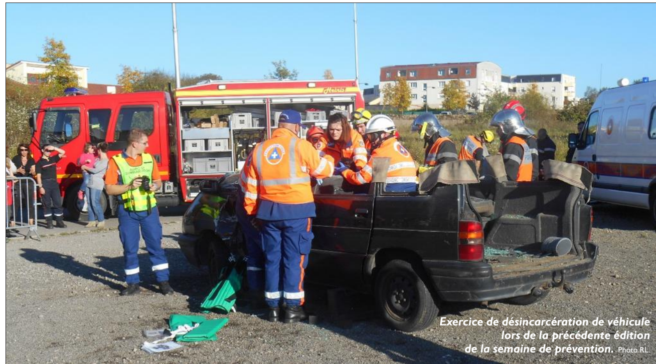
Exercice de désincarcération de véhicule lors de la précédente édition de la semaine de prévention.

Un quiz géant sur la sécurité routière, présenté par l'auto-école Jeannot de Guénange aura lieu vendredi 16 octobre à 20 h à la salle Voltaire. Venez nombreux tester vos connaissances pour cette manifestation gratuite, avec des lots à gagner à la clé.