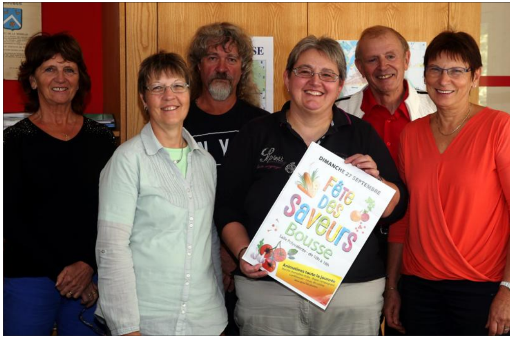
La commission sport loisirs culture et jeunesse et Bousse Anim' ont travaillé main dans la main pour donner naissance à la première fête des Saveurs programmée à Bousse ce dimanche.