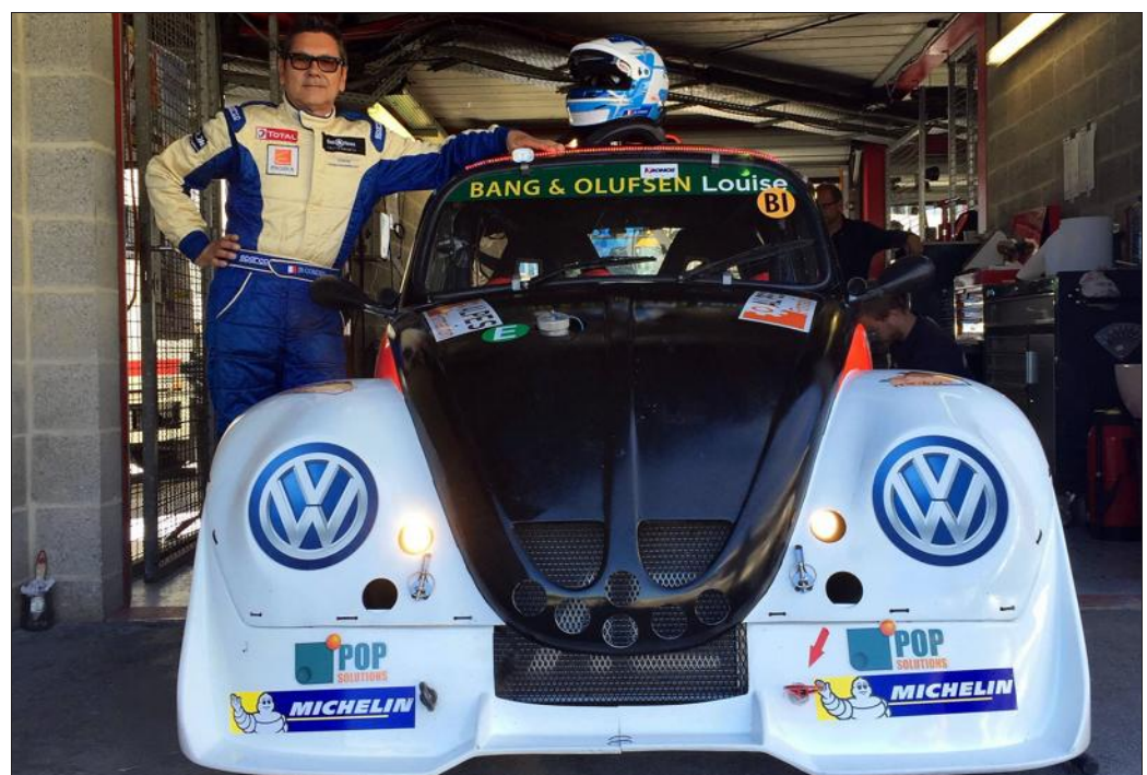
Pour Jean-Bernard, la course est un « plaisir personnel, un moment de détente ».