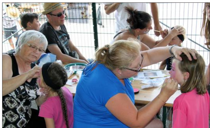
L'atelier maquillage n'a pas désempli de l'après-midi.

Dimanche, tous les enfants de la commune et les adultes aussi avaient rendez-vous à la première kermesse organisée par l'Association des Parents d'Élèves de l'École de Metzervisse (APEEM) dans la cour du groupe scolaire Jean Moulin. Les "Moulines à notes", la chorale du périscolaire, a ouvert les festivités avec son spectacle sur le thème des années 80, un medley reprenant des airs de dessins animés, des chansons connues de chanteurs débutants ou disparus, etc... Une ovation a salué la prestation des enfants.