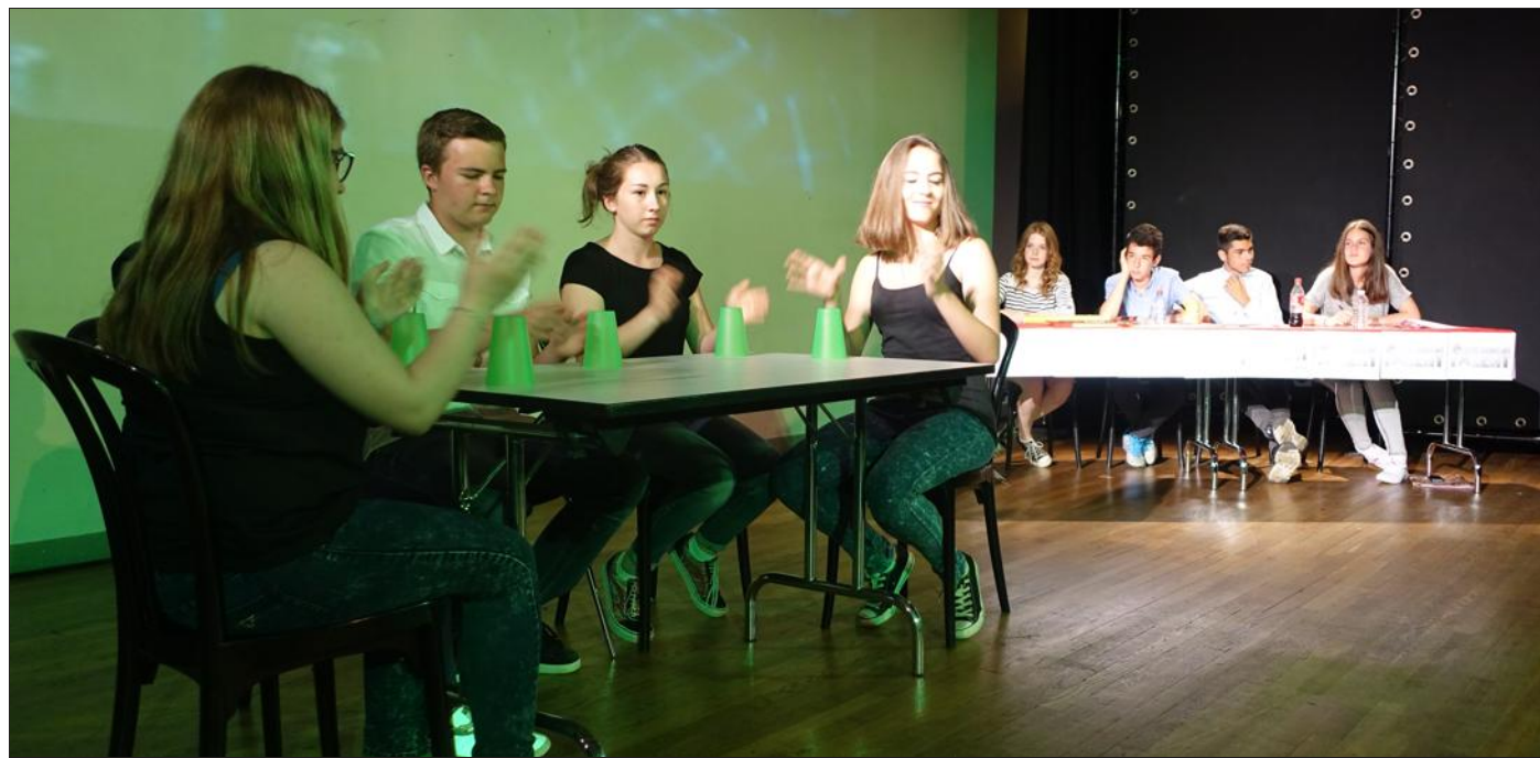
Les 4 membres du jury scrutent cette interprétation du cup song.

Plus de 200 spectateurs ont assisté à la représentation à la salle Voltaire, véritable point d'orgue du projet. Le public était essentiellement composé des familles, camarades, professeurs et du personnel administratif. C'était la première fois que le collège René