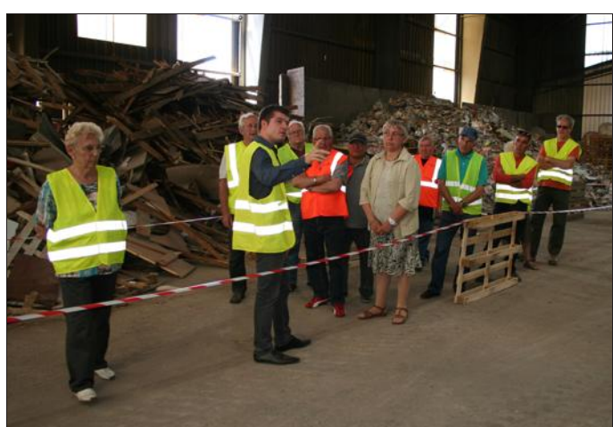
Visite de la déchèterie professionnelle.

Les semaines européennes du développement durable (30 mai au 5 juin, cette année) sont toujours l'occasion de sensibiliser aux enjeux du développement durable, apporter des solutions concrètes pour agir et inciter à l'adoption de comportements responsables. Sur le territoire de l'Arc Mosellan plusieurs actions étaient engagées sous l'égide de la Communauté de Communes : visite de l'ISDND d'Aboncourt