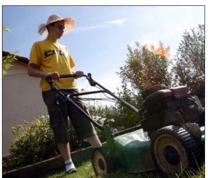
... un coup de main pour tondre le gazon...