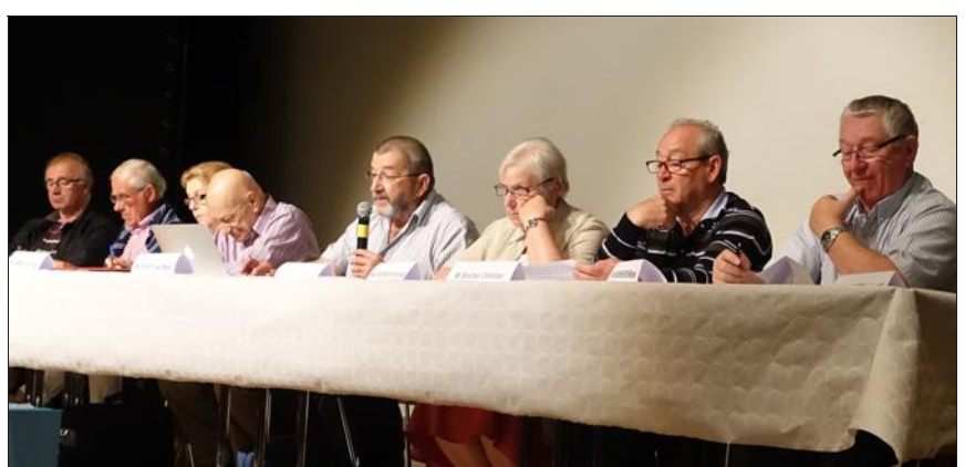
... Soliseniors propose de multiples actions pour faciliter le maintien à domicile. Les membres ont fait le point dernièrement lors de l'assemblée générale.

pour le financement d'actions ponctuelles ou des investissements. Soliseniors fait exécuter les travaux par des demandeurs d'emploi inscrits dans les structures d'insertion par l'activité économique, telles que Tremplin à Thionville (lire aussi notre article en page 3) ou AIDE à Mondelange. AIDE a été sollicité 94 fois en 2014. Enfin, si Soliseniors fonctionne si bien, c'est en grande partie grâce à l'engagement des bénévoles, et à une équipe technique dévouée.