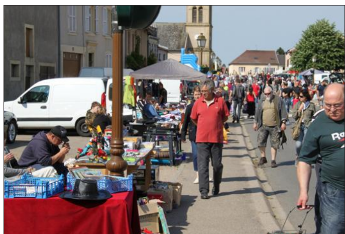
Les rues de Metzervisse ont connu une belle affluence tout au long de la journée.

Le club de football L'Avant-garde de Metzervisse avait décidé de changer la date de sa brocante, après avoir connu une météo maussade durant plusieurs années. Il semble avoir pris la bonne décision puisque ce dimanche, le soleil était au rendez-vous et a attiré les exposants dans le chef-lieu de canton. Ils étaient ainsi près d'une centaine à