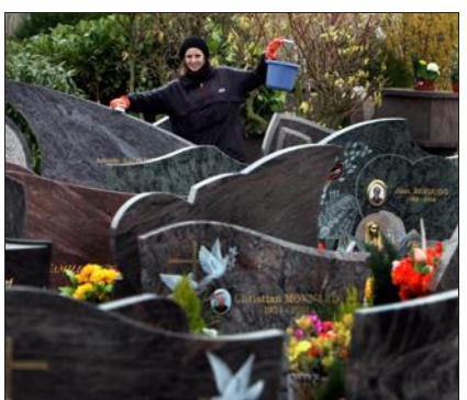
... ou encore entretenir les tombes des personnes chères...