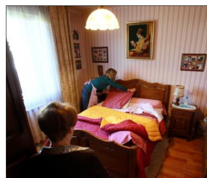
Un peu de ménage...

L'association Soliseniors propose des services de proximité pour les seniors de Guénange et Bertrange. Et ce, afin qu'ils puissent rester à leur domicile dans de bonnes conditions le plus longtemps possible. L'année 2014 a été une année record aussi bien en nombre d'interventions qu'en nombre d'usagers aidés.