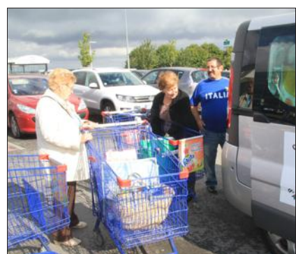
... un service de transport pour les courses hebdomadaires...