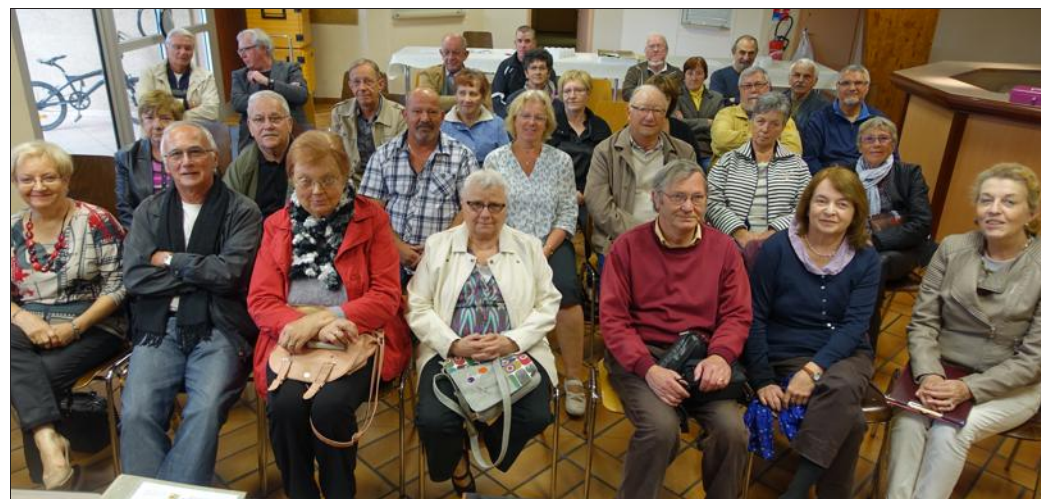
Les Amis de Lær entretiennent une relation privilégiée avec cette commune d'Allemagne.

prévu le dimanche 18 octobre prochain, toujours à la salle Pablo-Néruda.