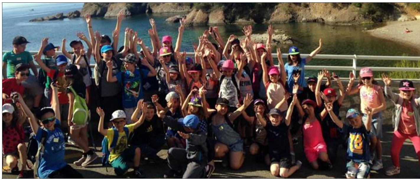
Imaginez la joie de ces enfants qui, pour la plupart, découvraient la mer pour la toute première fois.

Les enfants ont pu découvrir les paysages de Provence au cours de jolies randonnées, le milieu marin sur l'île des Embiez et les plages de La Ciotat. Ils ont pu suivre les traces de Marcel Pagnol qu'ils ont étudié en classe. Ce type de séjour est très enrichissant pour les élèves. Bien plus qu'un simple voyage scolaire, il s'agit d'une véritable aventure humaine où la vie en collectivité renforce les liens entre enfants, mais aussi avec les enseignants.