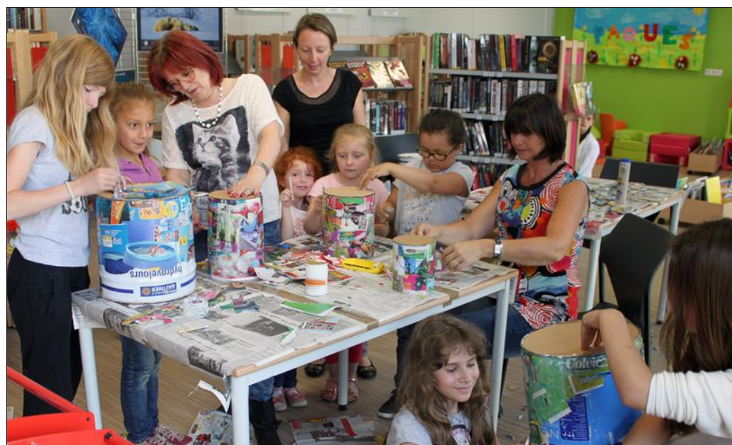
Les enfants ont fabriqué leurs instruments pour l'animation qui aura lieu samedi 13 juin.

Ces réalisations seront mises en œuvre le samedi 13 juin. Ce jour-là, à 14 h 30, tous les musiciens seront invités au