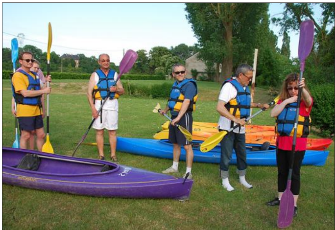
Initiation à la pagaie avant une balade gourmande.

Depuis quelques années déjà, la base nautique de Bousse du Canoë-kayak club de Bousse-Hagondange est ouverte à tous durant l'été, et propose des locations de canoës. Comme l'an passé, une des activités phares est la balade gourmande organisée tous les vendredis de 18 h 30 à 21 h.