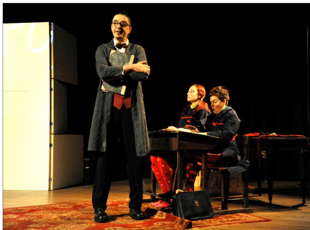
L'an dernier, les scolaires se sont régalés avec Mais qu'est-ce qu'elle dit cette morale ?

Autre moment fort et inédit, au restaurant du moulin de Buding, un dîner-lecture autour des textes et chansons de Boris Vian sera proposé le dimanche 19 juillet. Enfin, Les Bâtisseurs d'empire ou le Sch-