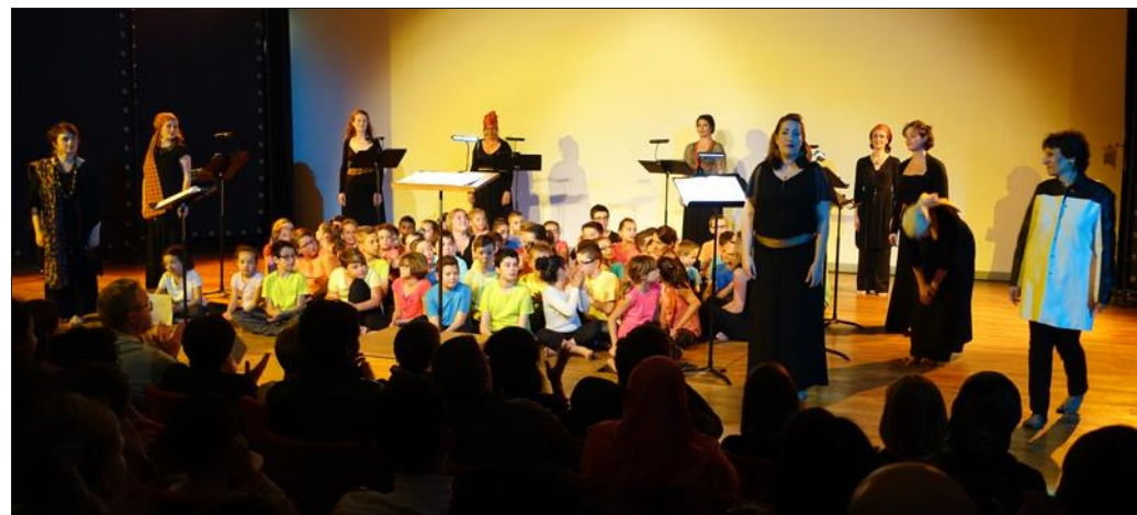
Quelle joie pour les enfants de partager la scène avec des artistes confirmées.

Interprète reconnu des œuvres du vingtième et du XXI e siècle, l'ensemble vocal professionnel Calliope voix de femmes cherche à dépasser les reticences d'un auditoire méfiant à l'encontre des compositions musicales