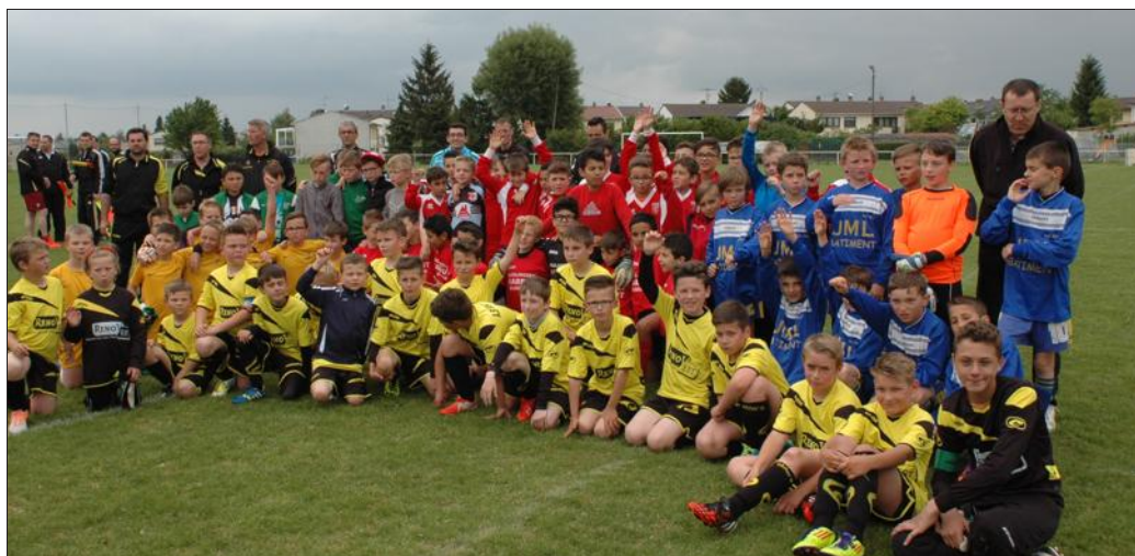
Les 10 équipes U11 à l'issue d'une longue journée entre éliminatoires et finales...