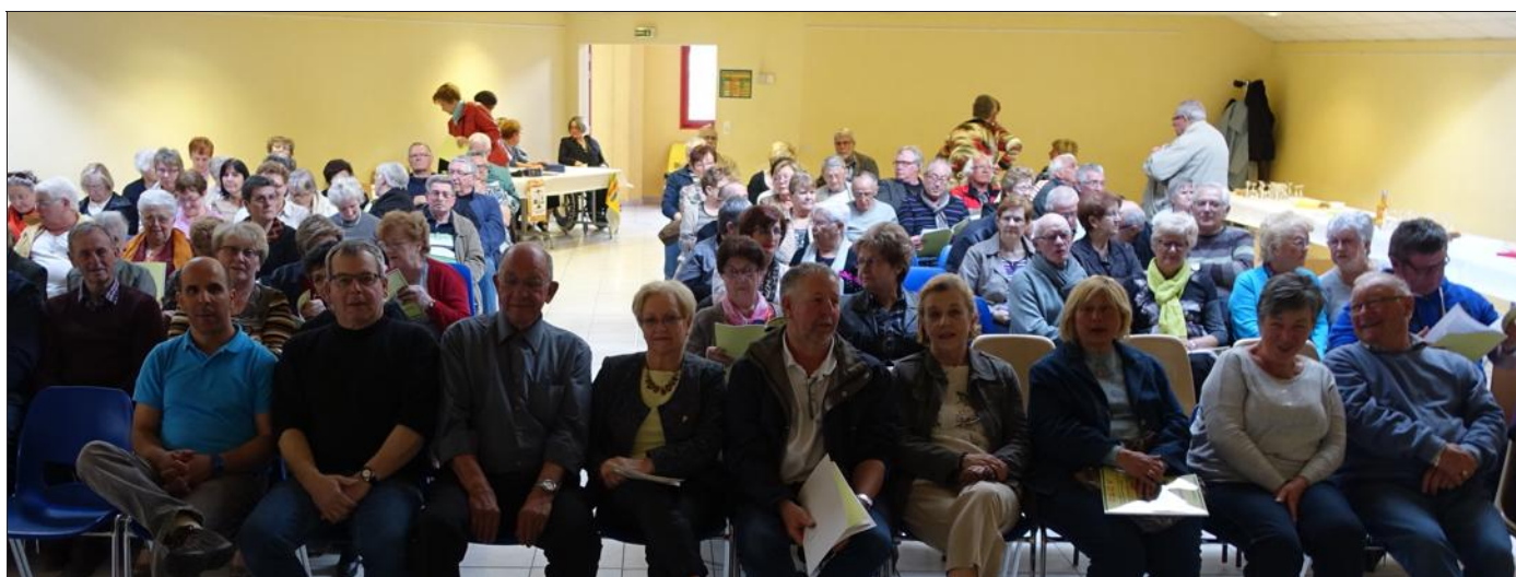
La C.L.C.V. informe, accompagne, et représente les intérêts des consommateurs, des locataires, et des usagers.

Toutes les démarches de la CLCV dénotent d'une volonté et d'une force de vouloir faire respecter les droits des consommateurs et des usagers. « grâce à une équipe de bénévoles qui est au plus près de vous, dans votre quartier, et toujours prête à vous