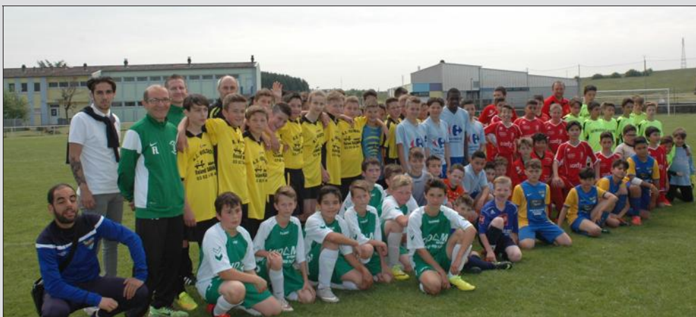
Les huit équipes U13 hier matin.

Hier matin, dès 9 h 30, par un temps idéal pour la pratique du football et sur une pelouse digne d'un club professionnel, les huit équipes U13 de Manom, Guénange, Bertrange, Volstroff, Guénange, Maizières-lès-Metz, Bouzonville et Elan Kobhéen engageaient les premières parties du challenge de la Municipalité de Volstroff (remise des trophées vers 18 h 30 en présence du maire et de ses adjoints).