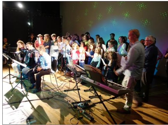
Pour terminer l'audition en beauté, artistes et spectateurs ont entonné Les Amants de Saint-Jean.