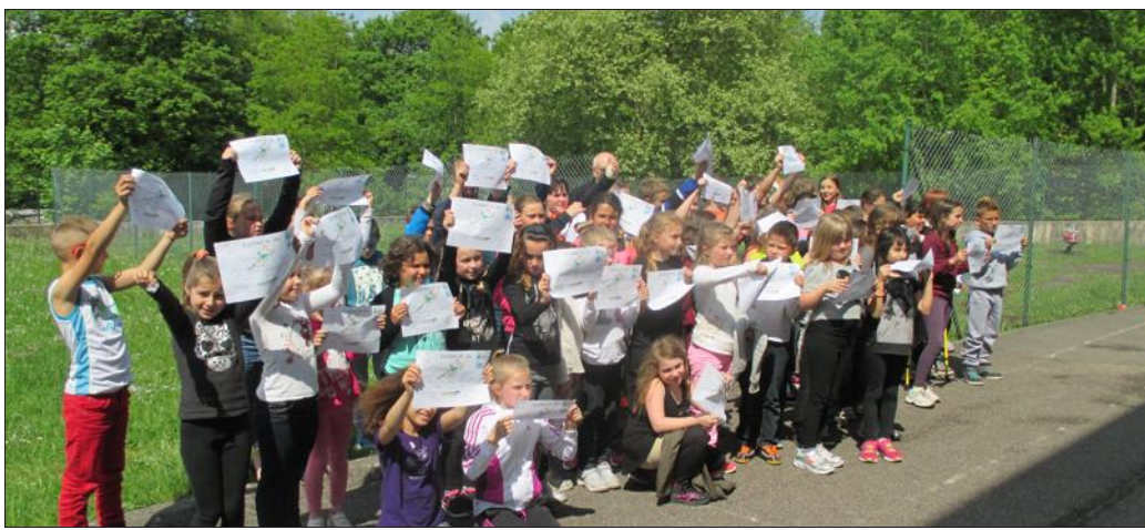
Heureux et fiers de leurs diplômes.