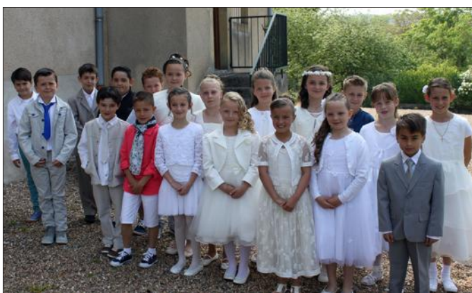
Depuis un an ces enfants se préparaient à ce sacrement.