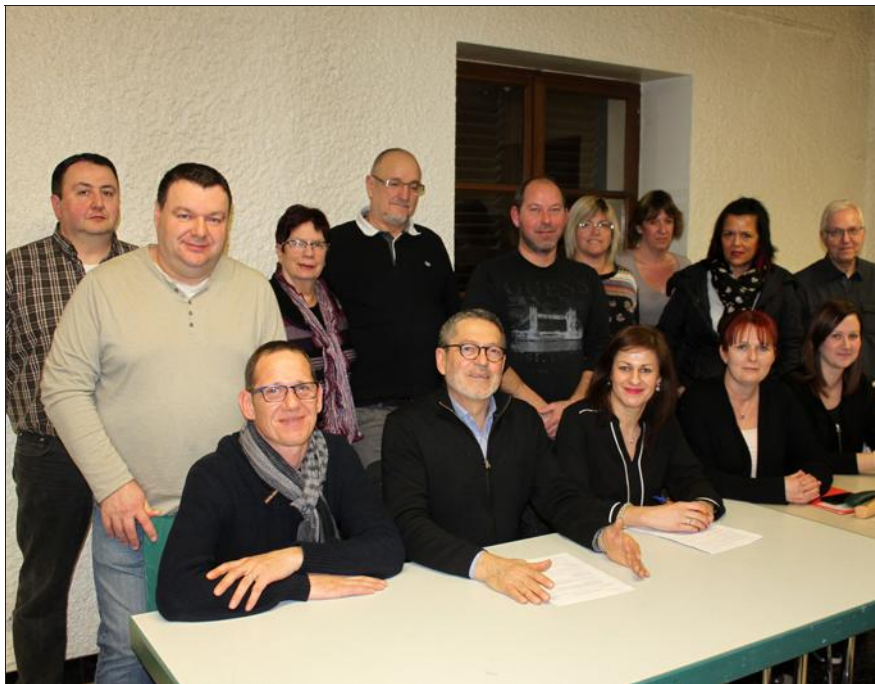
L'ACLAD entend stopper la baisse de ses adhérents en proposant de nouvelles activités et en menant une réflexion sur la politique de la jeunesse.