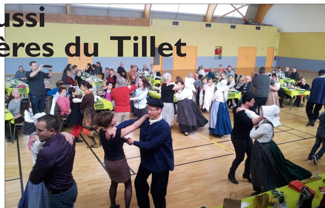
Danses et repas lorrains ont agrémenté cette belle journée.