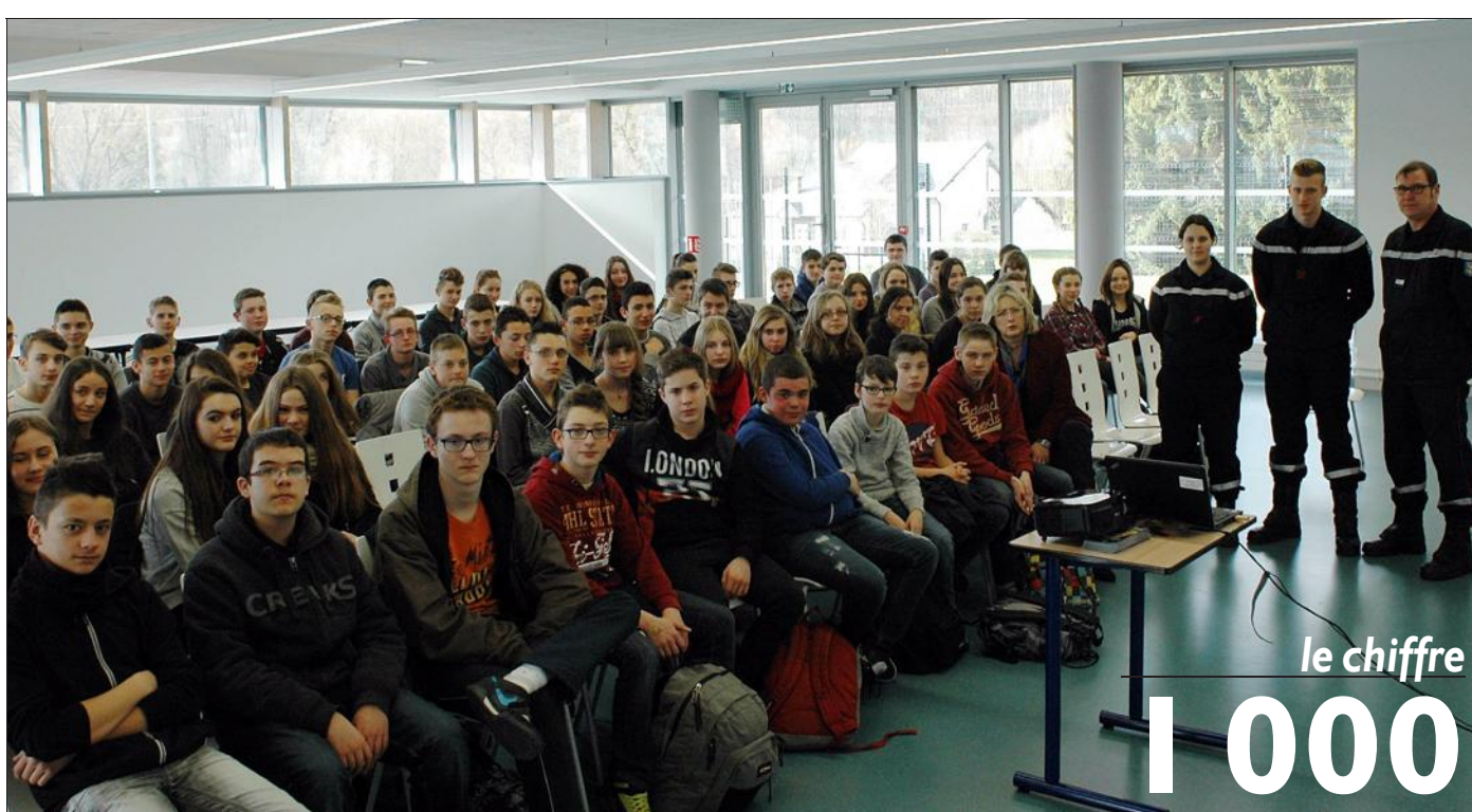
Des vocations sont peut-être nées chez les collégiens après l'exposé des sapeurs-pompiers volontaires.

« Devenir JSP, c'est développer son sens civique, ses aptitudes physiques, découvrir la force du travail en équipe, effectuer des gestes qui sauvent et apprendre à lutter contre le feu. On recrute des jeunes de 12 à 14 ans. En Moselle, près d'un millier de jeunes sont déjà inscrits dans une section de JSP pour suivre une formation de quatre années permettant d'acquiescer quatre modules successifs de JSP1 à JSP4. Un