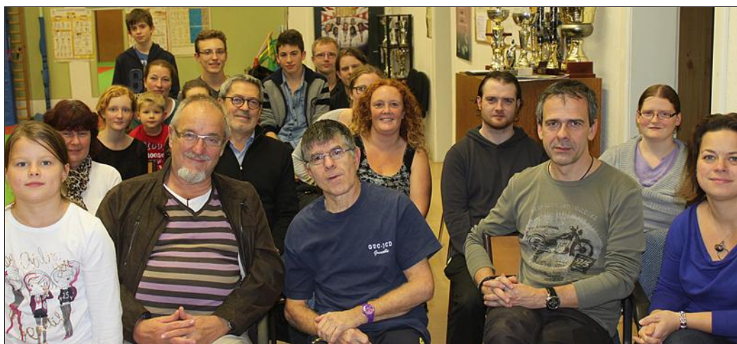
Le Judo-club suit son chemin tranquille au dojo de la Cour du Château.

Avec un effectif de plus de cent adhérents, les départs étant compensés par plus d'une dizaine de nouveaux inscrits surtout dans les groupes d'éveils, la participation du club aux compétitions officielles sera effective dans toutes les catégories où il