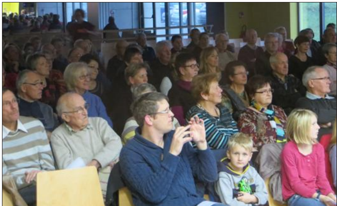
Un public émerveillé.

Quelque cent cinquante personnes ont investi la salle Arc-en-ciel, samedi dernier, pour applaudir l'ensemble Amatys et ses cinquante choristes, sous la baguette de l'excellent Willy Fontanel. Ce fut un voyage en chansons, un voyage enchanté à travers le temps, les rythmes et les continents d'une durée d'une heure trente. Un concert de très haut niveau une nouvelle fois.