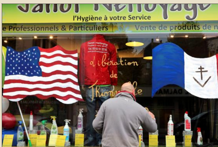
Les Thionvillois jouent le jeu des commémorations de la Libération à fond.