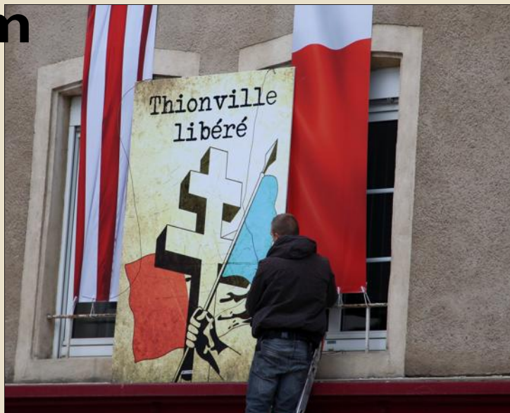
Une Croix de Lorraine sur la Place Claude-Arnould...