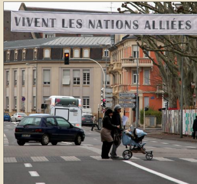
...Et déjà l'ambiance de Thionville libéré ! Rendez-vous aujourd'hui dans les rues de la ville pour fêter les 70 ans de la Libération.