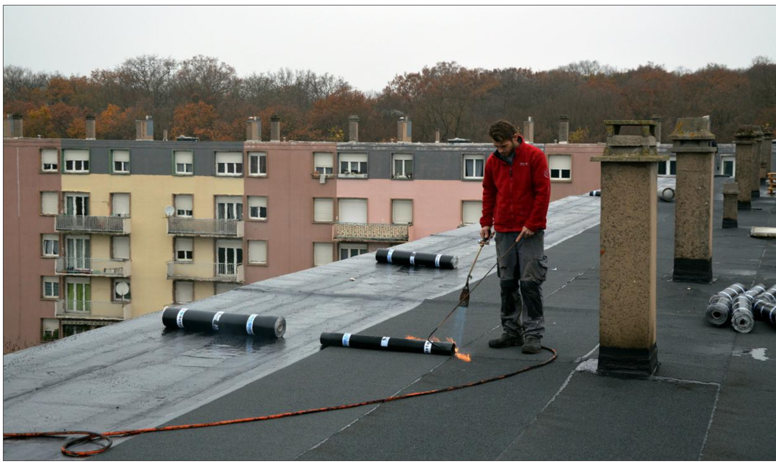
Le renouvellement urbain du quartier République, à Guénange, a déjà commencé. Ici, l'isolation d'un toit.

Pour le moment, le quartier République de Guénange a un côté "Ma cité va craquer". Pas dangereux comme dans le film, mais pas très accueillant non plus. Tout cela devrait radicalement changer d'ici 2017.