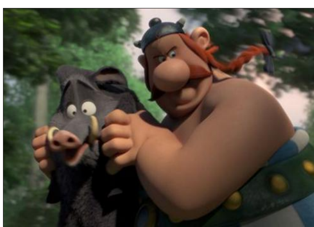
Le dernier Astérix à voir à Kinopolis et CinéBelval