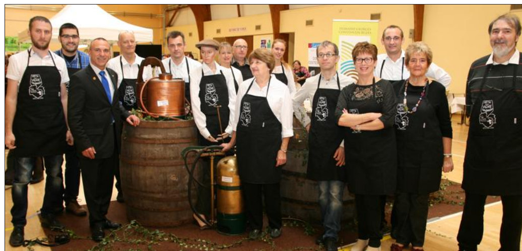
Cette sixième fête de la Vigne a été réussie selon les membres des amis du Père Scheil.