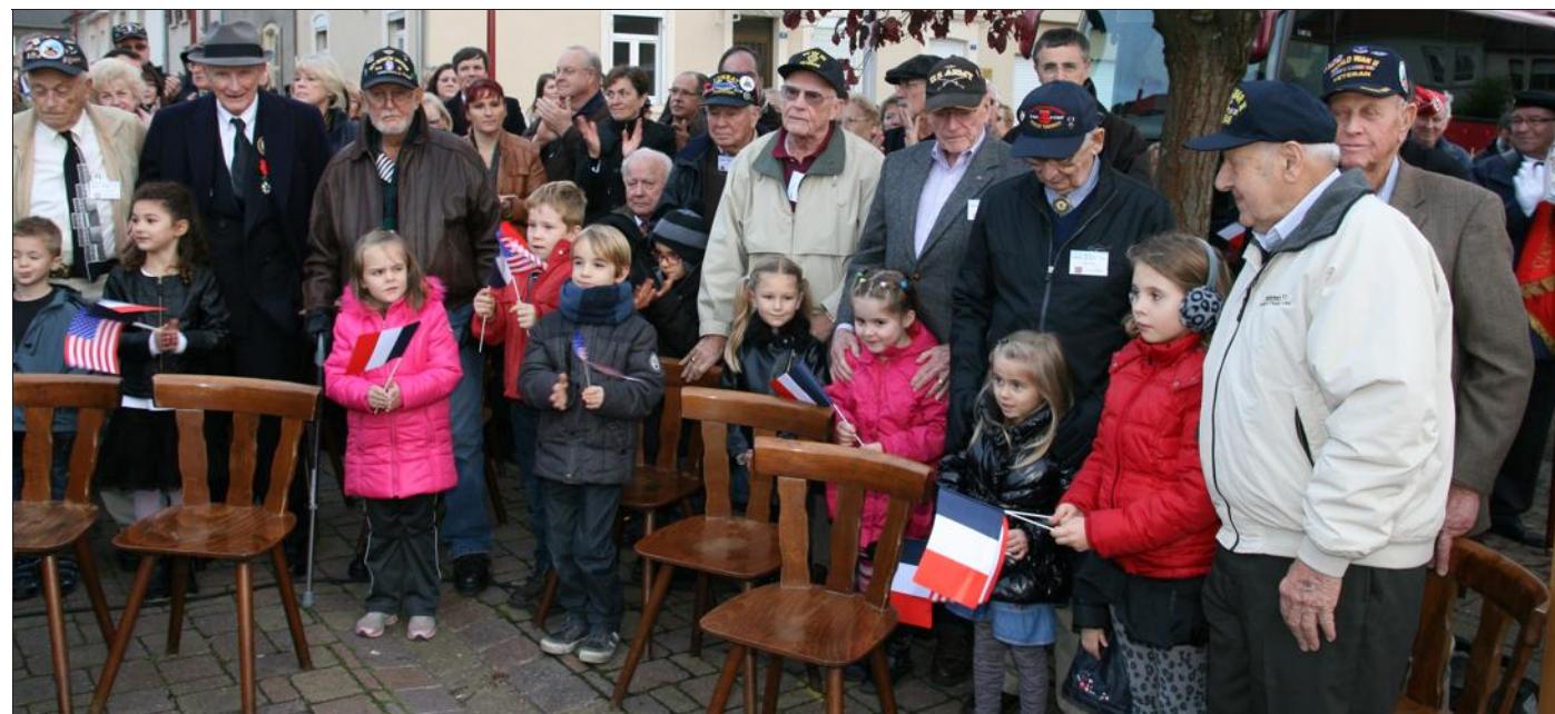
Les enfants des écoles présents aux cérémonies.

Ils ont encore une fois traversé l'Atlantique. Soixante-dix ans après le débarquement de novembre 1944, ils sont revenus sur les rives de la Moselle, à Kœnigsmacker. Ce sont quatorze vétérans, accompagnés de leur famille, qui sont venus assister aux cérémonies devant le monument aux Morts. Quatorze vétérans qui, debout, ont salué, pendant l'hymne national américain, leurs camarades tombés sur les terres mosellanes. Une cérémonie empreinte d'une double émotion, lorsque ces vétérans ont pris sur leurs genoux les jeunes du village venus leur rendre hommage pour ce qu'ils ont fait, au détriment de la vie de certains des leurs. Un devoir de mémoire qu'à tenu à signaler Pierre Zenner, maire, avant que ne retentisse la sonnerie aux morts suivie de La Marseillaise.