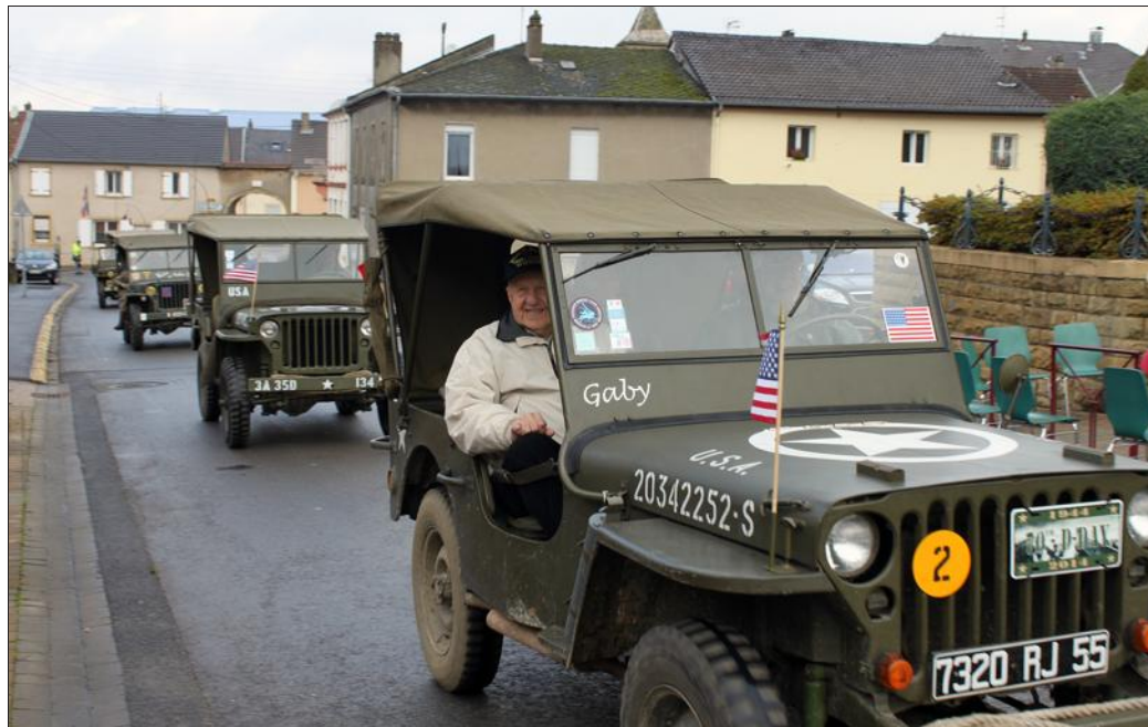
Défilé dans Distroff et arrivée en véhicules militaires d'époque pour quelques vétérans.