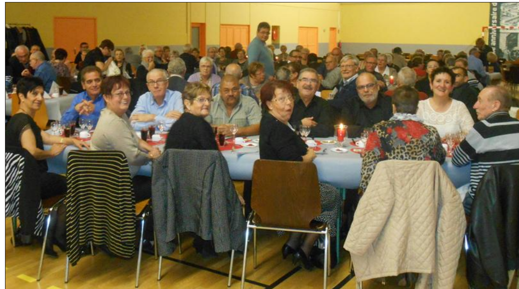
Ce sont 120 personnes qui ont participé au repas.

surtout les problèmes de la consommation (démarchage par les fournisseurs d'énergie, la téléphonie, les travaux dans les habitations...). Cette année 2014, il reste la participation à la Semaine européenne de réduction des déchets par la communauté de communes de l'Arc Mosellan, qui se traduira par une collecte de jouets pour les enfants défavorisés, dans la galerie marchande de l'Intermarché de Guénange, les 25 et 27 novembre, de 9 h à 17 h, ainsi que le voyage au Marché de Noël de Cologne, le 29 novembre. Le président et son comité ont apprécié la soirée qui a permis à nombre d'adhérents de se retrouver. Tous nous donnent rendez-vous pour le repas de 2015 avec une nouvelle saveur au menu.