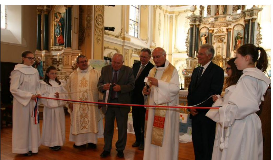
Tradition respectée ! Les rubans ont été coupés pour l'inauguration.