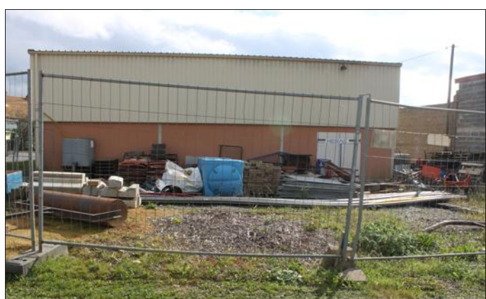
C'est par l'arrière du bâtiment, en forçant une porte métallique (à droite), que les voleurs sont entrés.

Drôle de surprise hier matin (mardi 14 octobre) lors de la prise de service des deux employés communaux de Metzervisse. En arrivant à l'atelier, rue du stade municipal, ils ont été intrigués de voir la porte du garage entrouverte. Leurs craintes étaient fondées car en entrant dans le bâtiment ils n'ont pu que constater les dégâts. Le véhicule Citroën Berlingo, acquis en mars dernier, avait disparu durant la nuit, mais pas seulement. Étant entrés par effraction par la porte arrière métallique qu'ils ont forcée, le ou les voleurs ont chargé tout ce qu'ils pouvaient dans la fourgonnette, dont un nettoyeur haute-pression, une débrous-