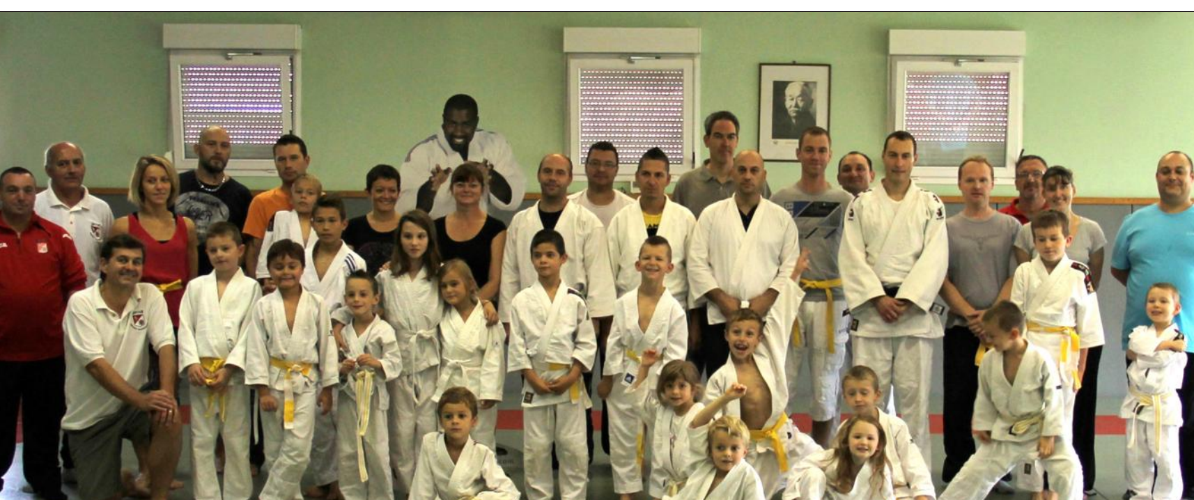
Une star en carton s'est glissée sur cette photo... Serez-vous la reconnaître ?

Le Judo club de Rurange Montre-quienne a organisé, dimanche dernier, à partir de 10 h 30 au dojo, la traditionnelle fête du judo.