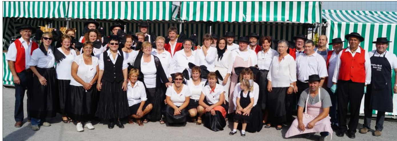
Les bénévoles, artisans d'une nouvelle fête patronale réussie.