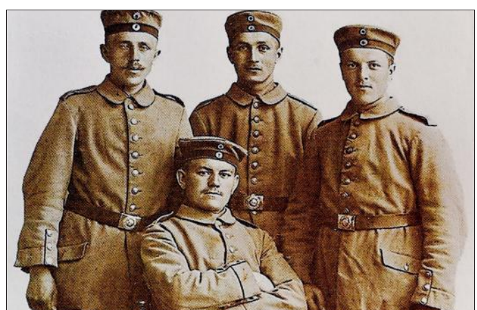
Des Guénangeois avec l'uniforme allemand.