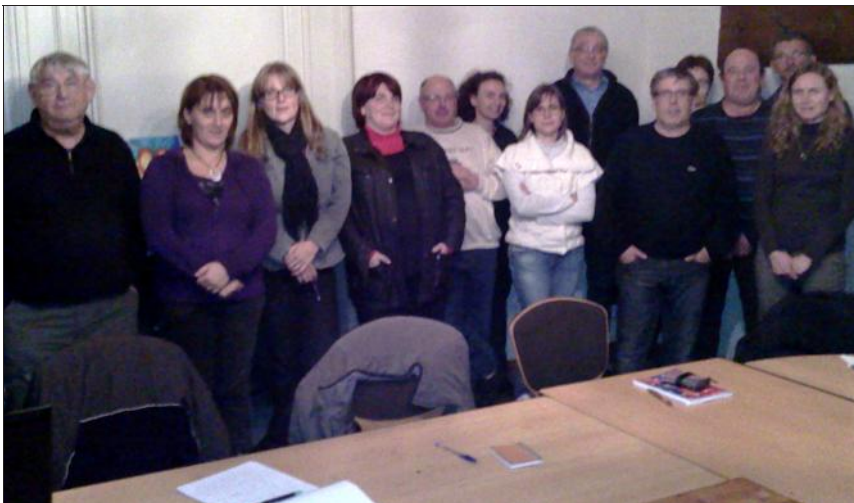
Les membres de l'association luttangeoise se sont réunis mardi soir pour faire le point sur cette deuxième année de fonctionnement qui vient de débuter.

Très vite, une soirée jeux a vu le jour. « Elle a connu un beau succès et on aimerait en organiser une par trimestre. » Il y a aussi eu la fête de la